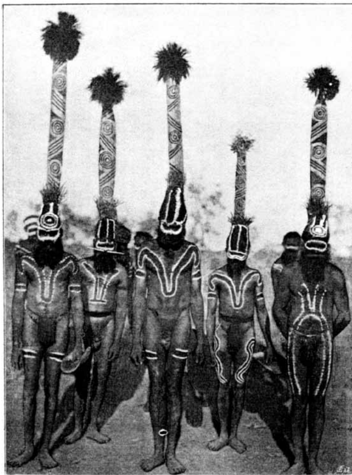
Болдуин Спенсер сделал эту фотографию во время семинедельного цикла церемоний во дворе телеграфной станции. До него так и не дошло, что он оказался вовлечен в одну из наиболее успешных PR-кампаний в истории.